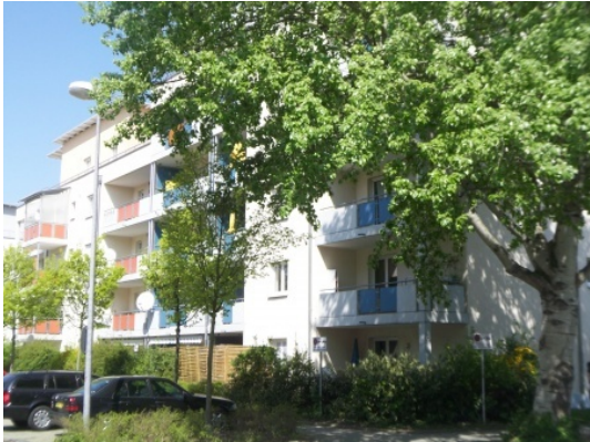
3.OG mit Lift