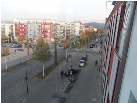
R39_W3_5 Blick Ost Rieselfeldallee