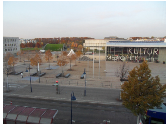
R39_W3_5 Blick Marktplatz_02