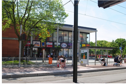
"ZO" Shopping/Sportcenter 300m vor der Türe