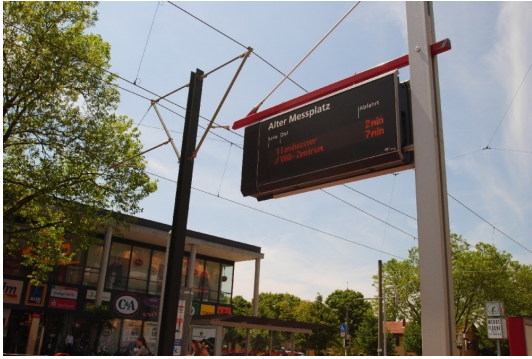
Straba 300m in die Innenstadt/Uni/PH