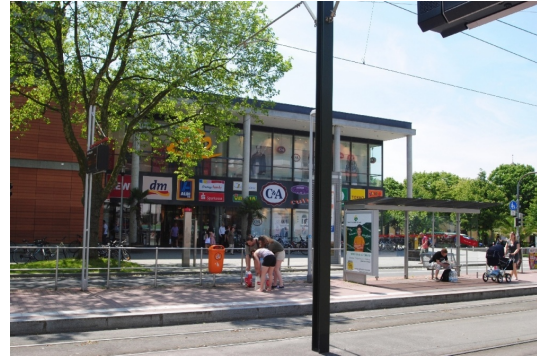
"ZO" Shopping/Sportcenter 300m vor der Türe