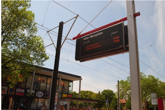
Straba 300m in die Innenstadt/Uni/PH