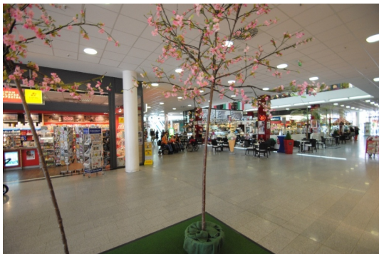
Um die Ecke Rundumversorgung