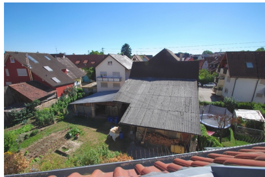
Über den Dächern von Opfingen