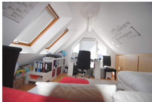
Klasse Studio mit Fernsicht