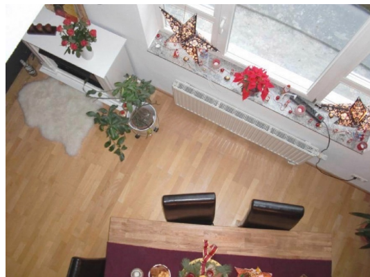
Viel Luft und Licht