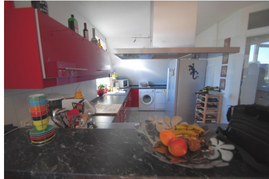
Hier kochen Sie mit Freunden u. Familie gerne