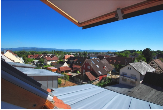
Blick nach Osten