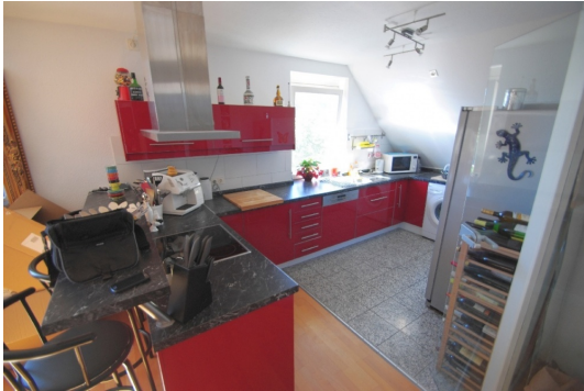
Voll ausgestattete Marken- EBK mit Kochinsel, saniert Ende 2009