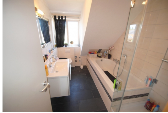
Masterbad Ende 2012 hochwertig saniert