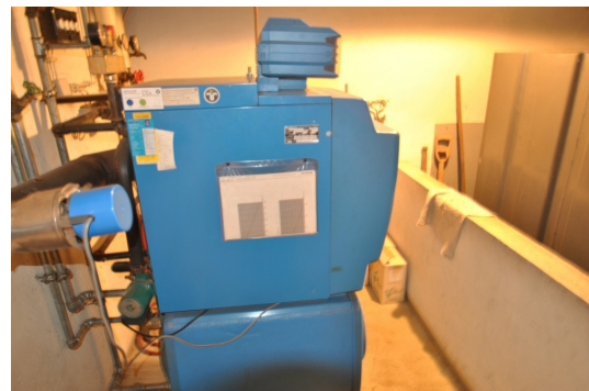
Buderus Zentralheizung u. zentrale Warmwasserversorgung