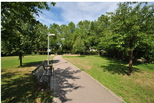
Lassen Sie sich um den Park direkt am Hause beneiden