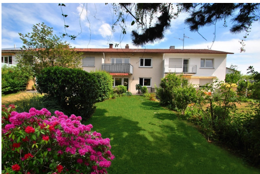
Blick über den Garten zum Haus