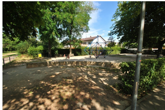
Die Lage macht's! Moderner Spielplatz im Park