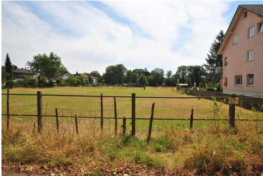
Wohnen in guter Nachbarschaft! Ganz nah "Perdekoppel"