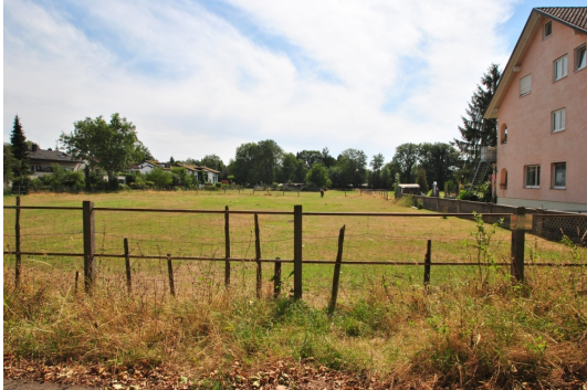
Wohnen in guter Nachbarschaft! Ganz nah "Perdekoppel"