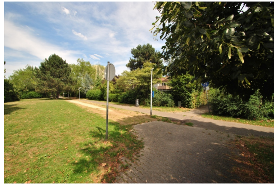
Für die kleinen und großen Kinder ganz viel Parkfläche