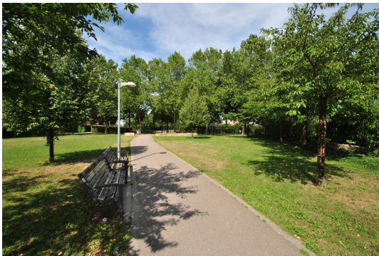
Lassen Sie sich um den Park direkt am Hause beneiden