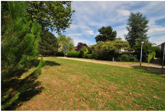
Lage ist Trumpf! Durch Ihr Gartentor und Sie sind direkt im Park