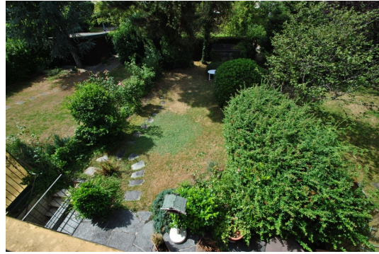
Kaufen Sie die Lage! Sie haben Ihren Traumgarten gefunden!