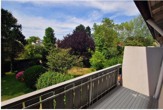
Sonnenbalkon Blick in alten Baumbestand