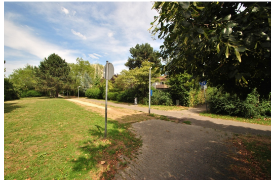
Für die kleinen und großen Kinder ganz viel Parkfläche