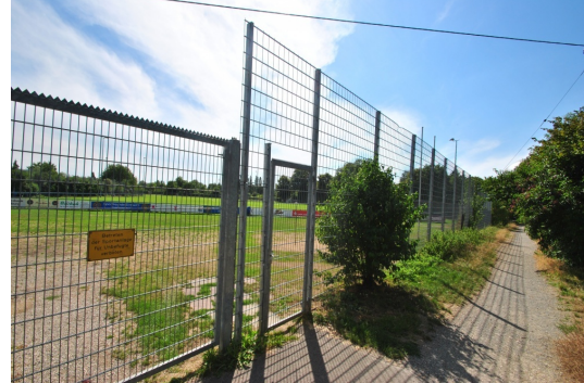
Ganz nah Sportglände der Eintracht Freiburg u. Tennisplätze