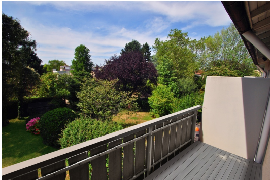
Sonnenbalkon Blick in alten Baumbestand