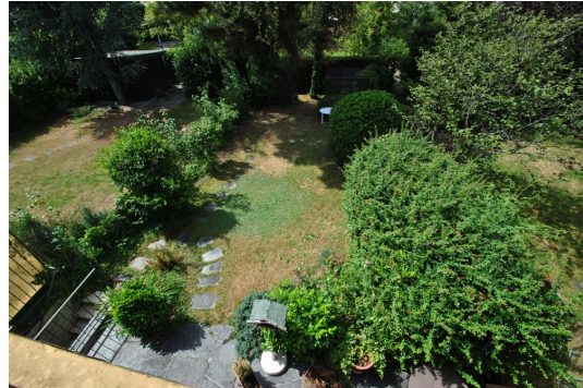
Kaufen Sie die Lage! Sie haben Ihren Traumgarten gefunden!