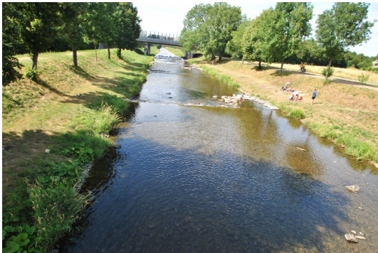
Unschlagbar gut! In 3 Fußminuten erreichen Sie das Dreisamufer