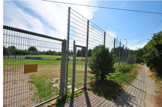
Ganz nah Sportglände der Eintracht Freiburg u. Tennisplätze