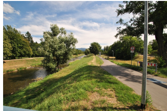
Ruhige Idylle! Hier verbringen Sie gerne Ihre Freizeit