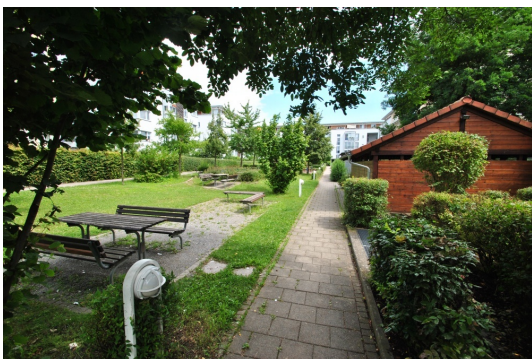
Gartenanlage mit Müll- u. Fahrradhäuschen