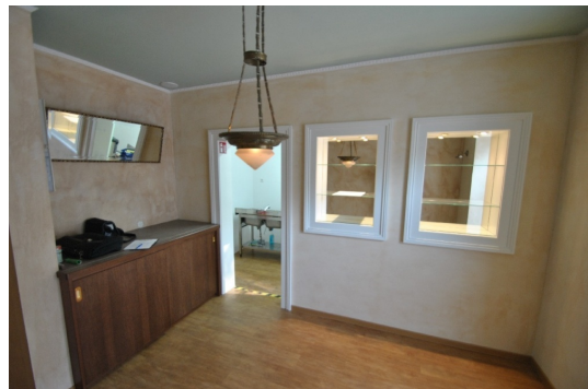
Bar für Kaffeemaschine