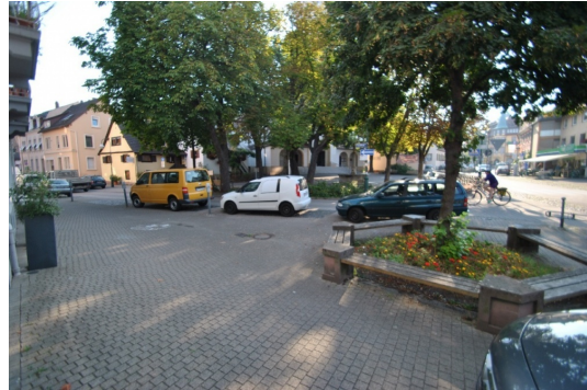
Herrliche Aussichten auf den Kirchplatz