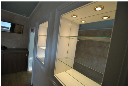
Showtime für Ihre Produkte