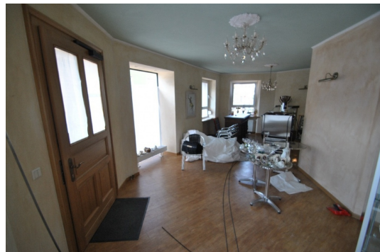
Stilvoll neu sanierte Innräume