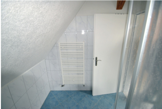
1 Z/K/B im DG, momentan vermietet