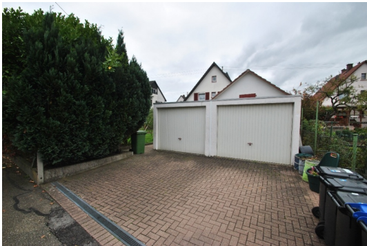
2 Garagen Hausrückseite