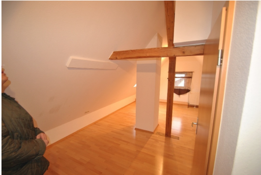
1 Z/K/B im DG, momentan vermietet