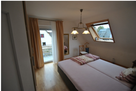
3 Z/K/B im 1.OG