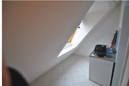
1 Z/K/B im DG, momentan vermietet