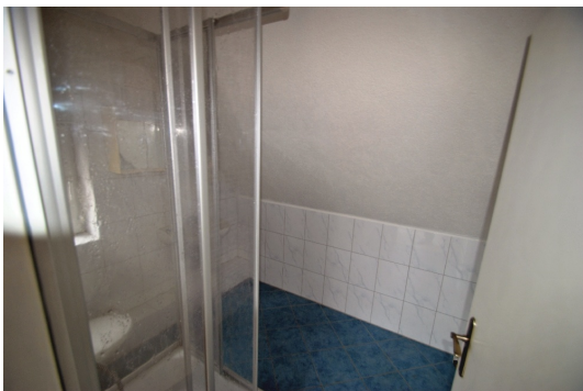
1 Z/K/B im DG, momentan vermietet