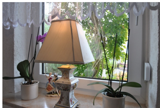
Kunststoffrahmenfenster mit Isolierverglasung