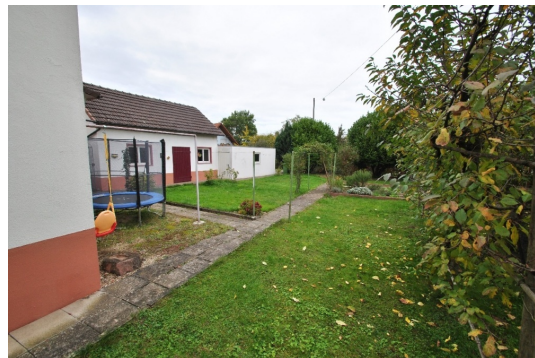
Garten mit Schopf