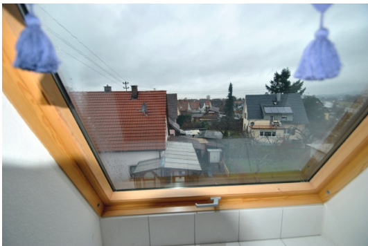
1 Z/K/B im DG, momentan vermietet