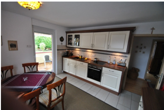
inkl hochwertiger Alno Küche mit Siemens +AEG Geräten