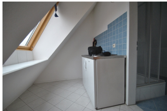
1 Z/K/B im DG, momentan vermietet