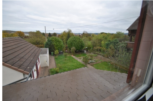
Lage ist Trumpf!