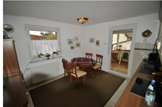
3 Z/K/B im EG