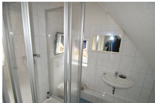
1 Z/K/B im DG, momentan vermietet