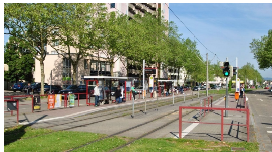
Straßenbahn vor der Türe. 10 min bis Innenstadt