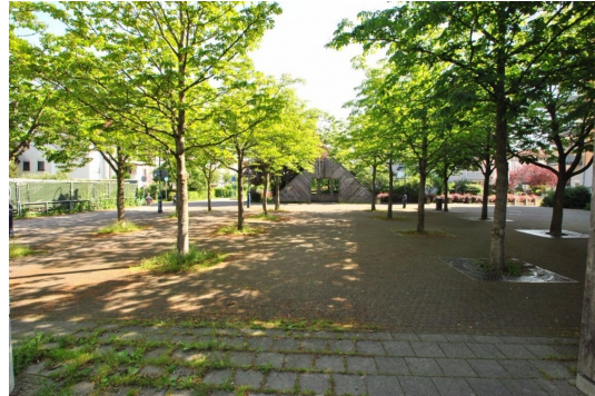
Eingang zum See liegt in nur 150m entfernt