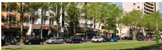
Eis, Cafe, Restaurants und Supermärkte