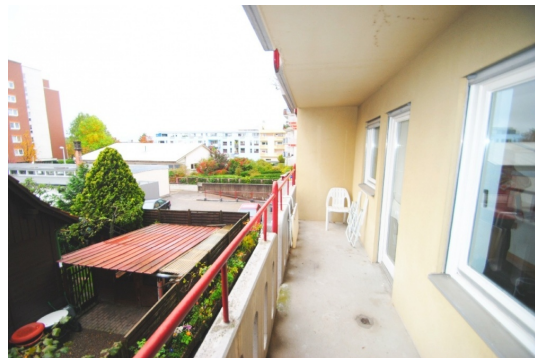
Die geschlossene Blockrandbebauung blendet den Straßenverkehr aus