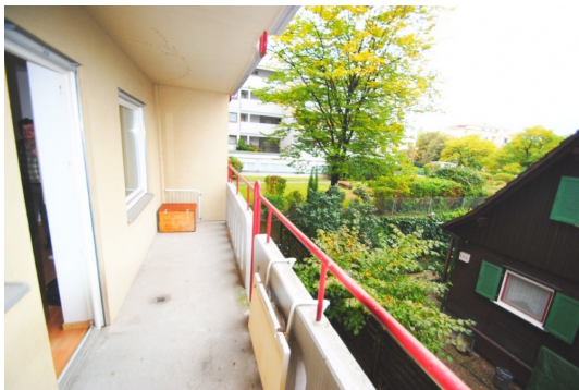
Schöne Mikrolage und Ausrichtung an der Hausrückseite