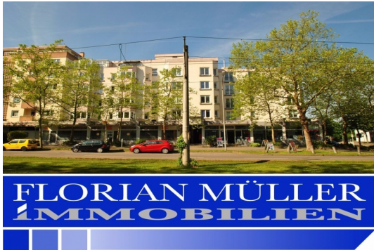
Gesuchte Lage mit hohem Freizeitwert