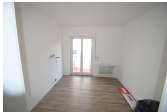
Küche ohne EBK