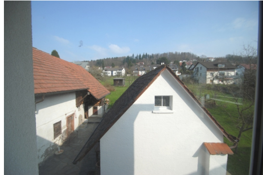
Blick aus der Küche