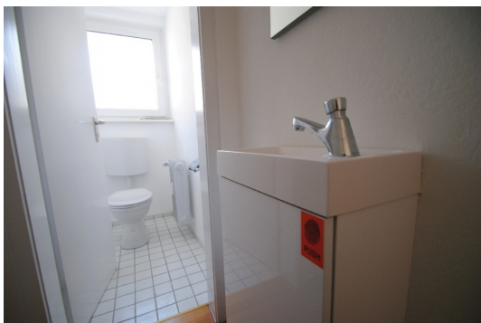
Gäste WC Abb. ähnlich