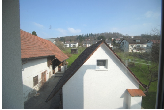
Blick aus der Küche