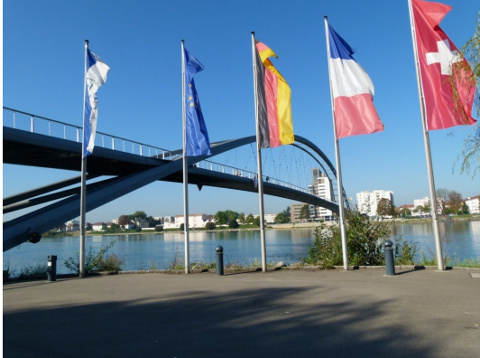
Passerelle Trois Pays zu Fuß