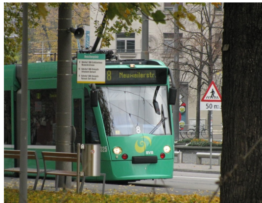
Tram8 zu Fuß