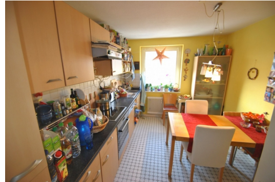
Wohnküche mit Eßplatz