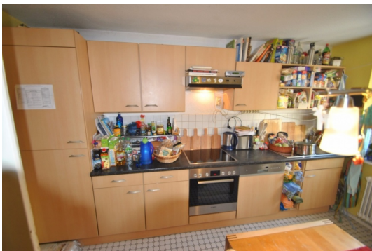
Die EBK erwerben Sie mit