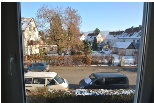
Weitblick zum Schwarzwald