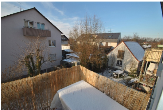
Sonnige Zeiten auf sehr gut nutzbaren Balkon