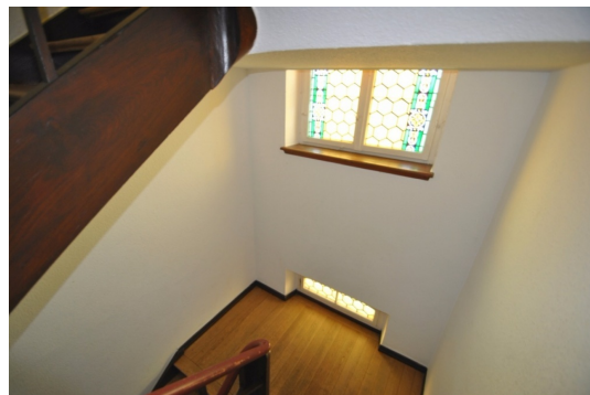
Gepflegtes und liches Treppenhaus