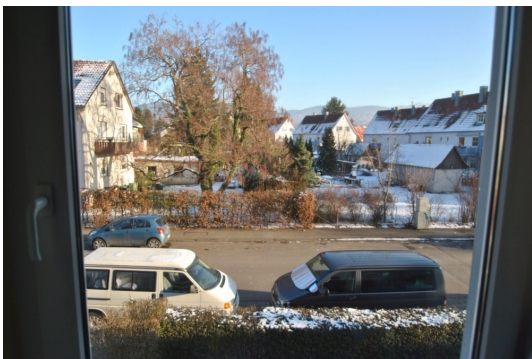
Weitblick zum Schwarzwald