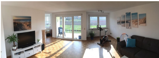
Hell mit hohem Wohnwert