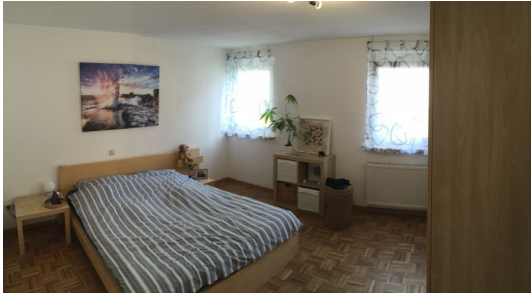
Helles und geräumiges Schlafzimmer