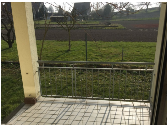
Jeden Tag ein bisschen Feriengefühl