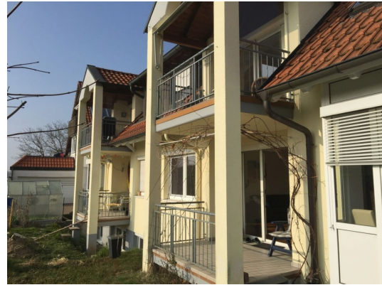
Platz und Spaß für die ganze Familie