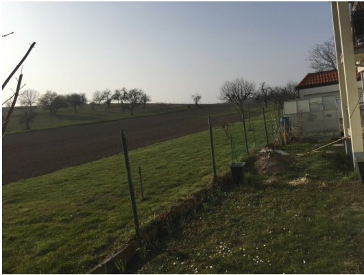
Tief durchatmen und genießen