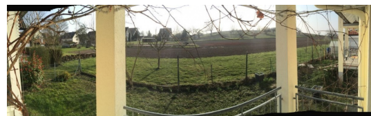
Garten- u. Kinderparadies