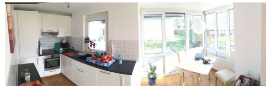
Dieser Wintergarten wird Ihnen gefallen