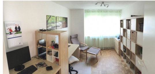
Hier fällt die Arbeit nicht schwer