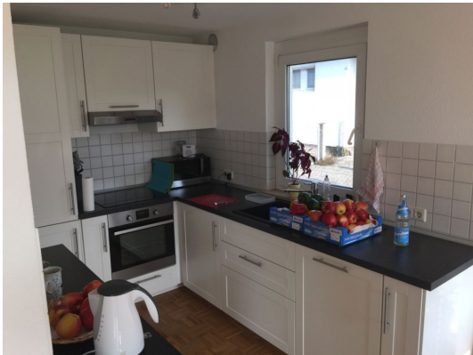
EBK wird mit vermietet