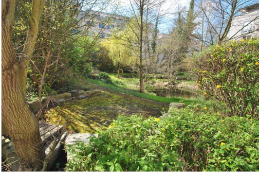
Der Park ist Ihr Nachbar