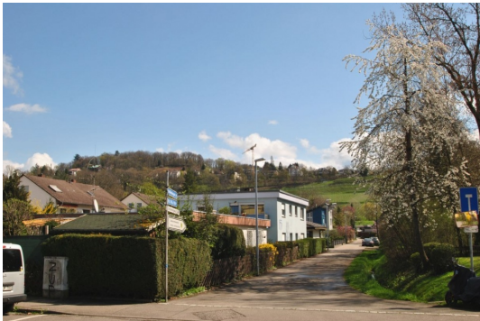
Vor der Haustüre gleich los spazieren und den Schlierberg genießen