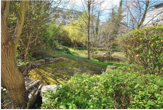
Der Park ist Ihr Nachbar