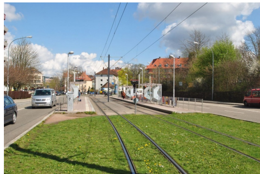
In 5min zur Stadtmitte und Uni