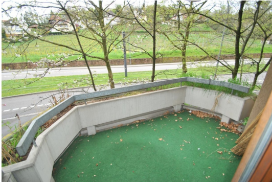
Beste Aussichten zum Lorettoberg