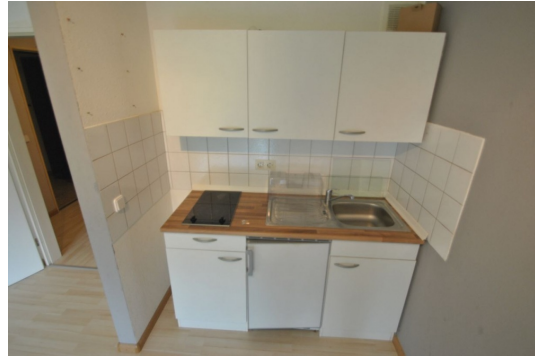
Im Kaufpreis inkludiert