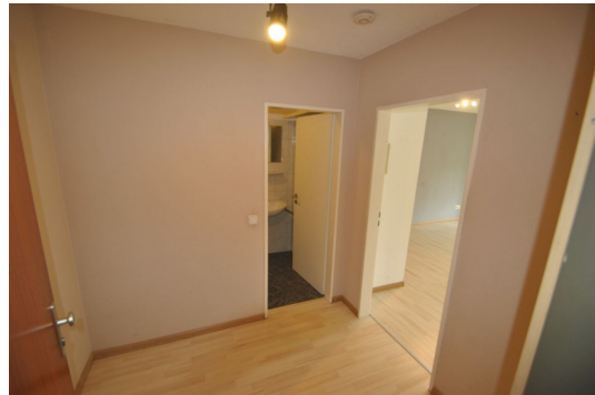
Guter Apartmentschnitt mit gut zu möblieren Flur