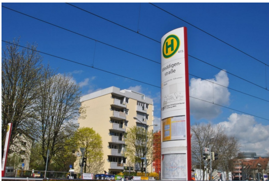
Einige wenige Schritte vom Hause