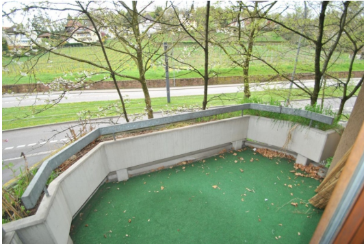
Beste Aussichten zum Lorettoberg