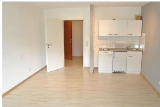
Alles da, alles drin!