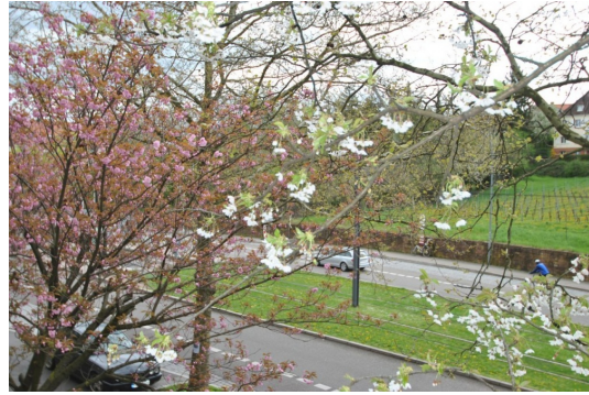
Alter Baumbestand vor dem Hause