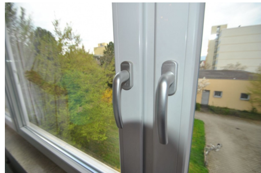
1993 erneuerte Fenster