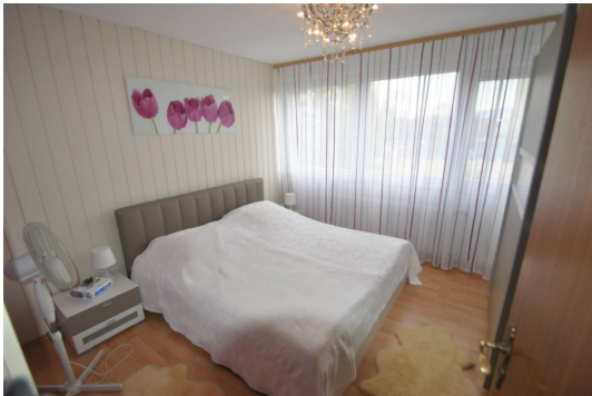
Großzügige Fensterflächen gegen Süden für helle Räume