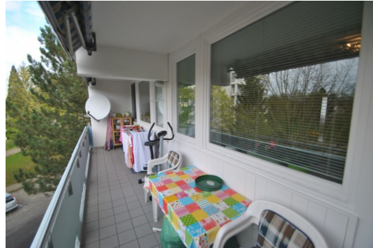
Sonnenbad oder Kaffee und Kuchen auf dem Sonnen- Südbalkon