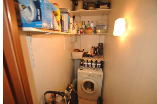
In der Wohnung waschen