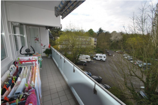
Ganz oben wohnen!