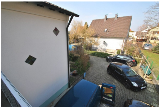
Viel Platz und zweite Terrasse vor dem Hause