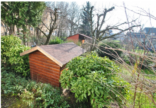
Spaß und Platz für Familie mit Kindern