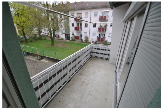
Zimmer mit Balkon