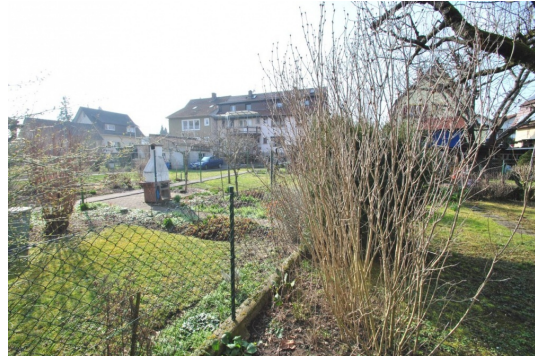
Nachbarbebauung in angenehmen Abstand