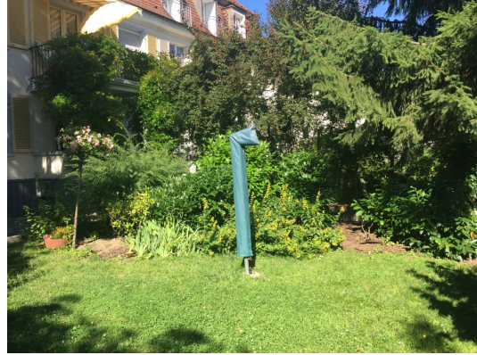
Gemeinschaftsgarten hinter dem Hause