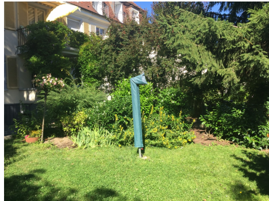
Gemeinschaftsgarten hinter dem Hause