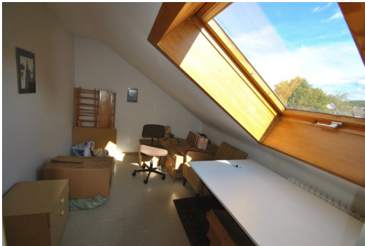
DG mit kleinem Zimmer