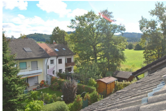
Viel Natur am Hause