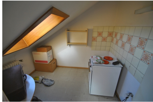
Küche im DG