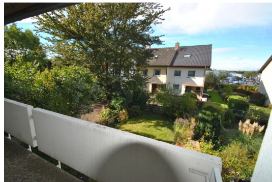
Blick zum Kaiserstuhl