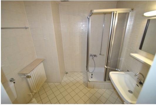
Duschbad im DG