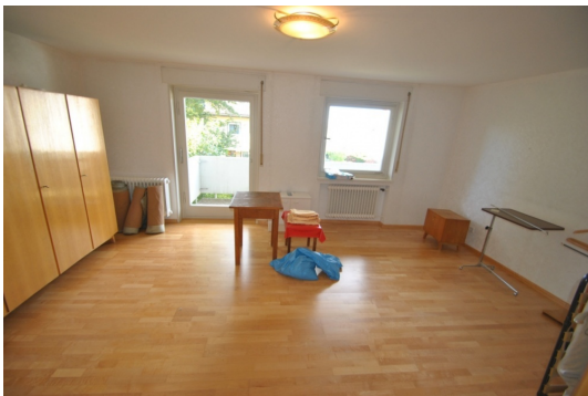
1.OG großes Zimmer