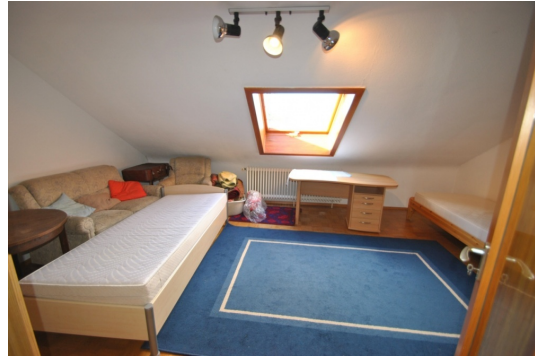
DG mit großem Zimmer