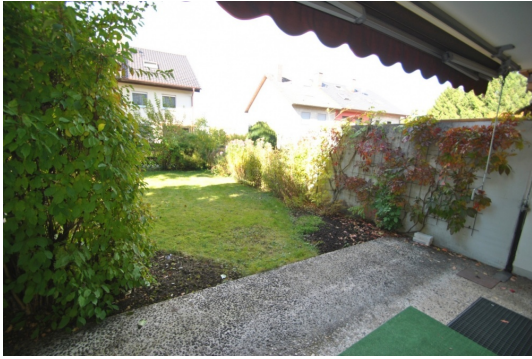
Garten und Terrasse mit sonniger Westausrichtung