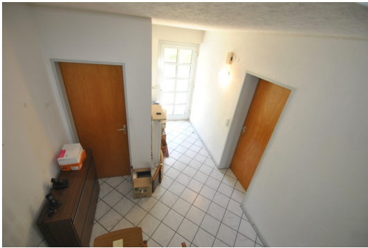
Helles Entre mit Gäste WC