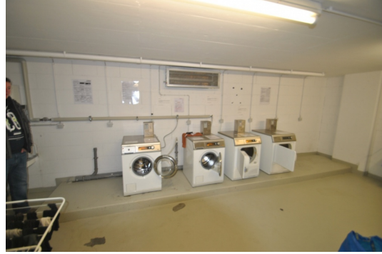
Wash- und Trockenraum