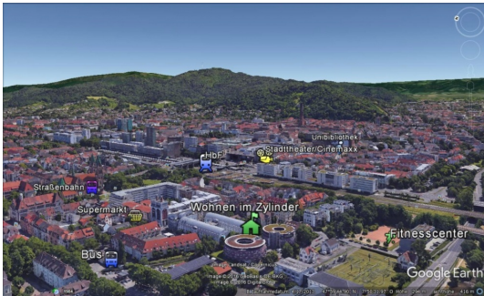
Im Herzen der Stadt