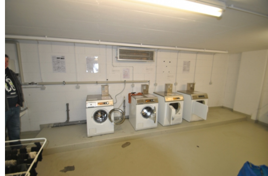
Wasch- und Trockenraum