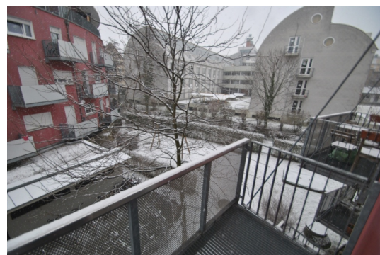
Der Frühling kann kommen