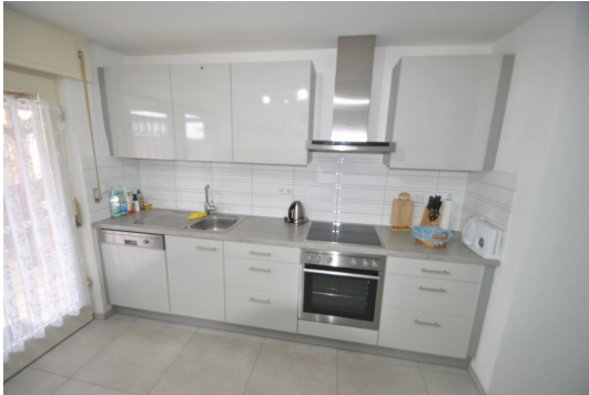
Marken-EBK ist Teil der Mietsache