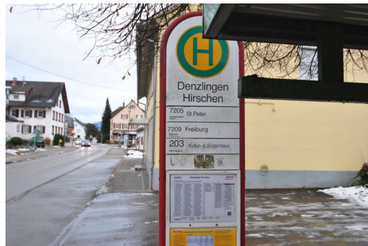
10m vom Hause