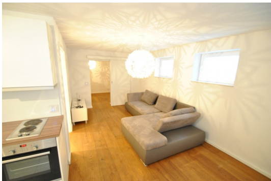
Teilmöbliert wie abgebildet