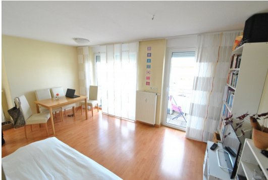
Wohnzimmer in lichter Süd-West Ausrichtung