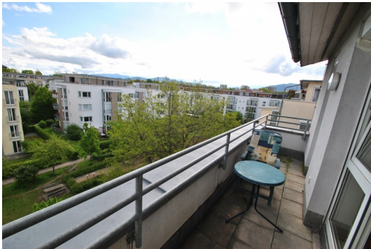
Hausrückseite Richtung Gärten