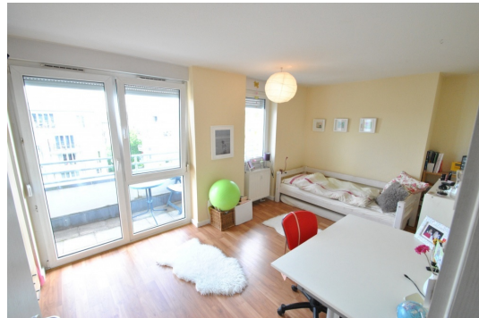
Herrliche Nord-Ost Seite mit Morgensonne