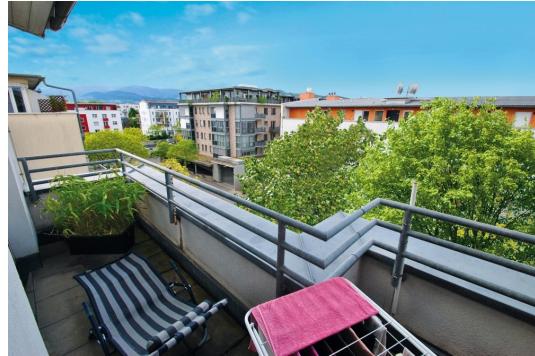
Beste Aussichten von 2 Dachterrassen