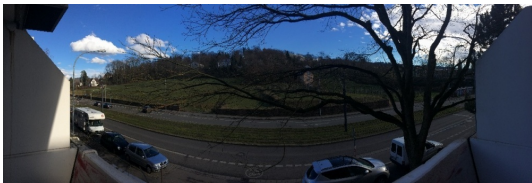
Toller Blick Lorettoberg