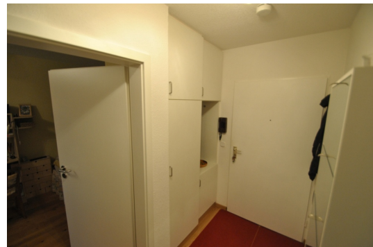
Einbauschränk im Flur