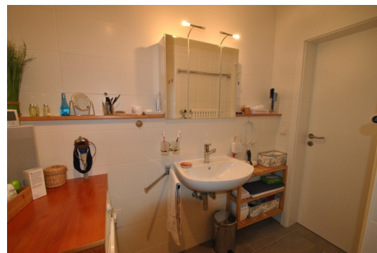
Platz besten genutzt