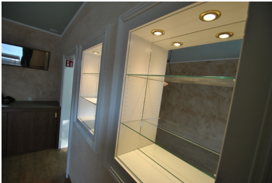
Showtime für Ihre Produkte