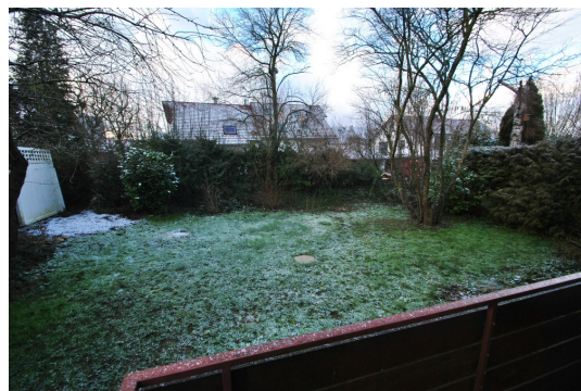
Grundstück in sonniger Südlage