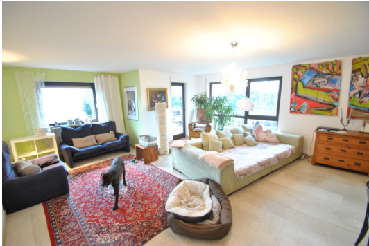
Hell und großzügig wohnen