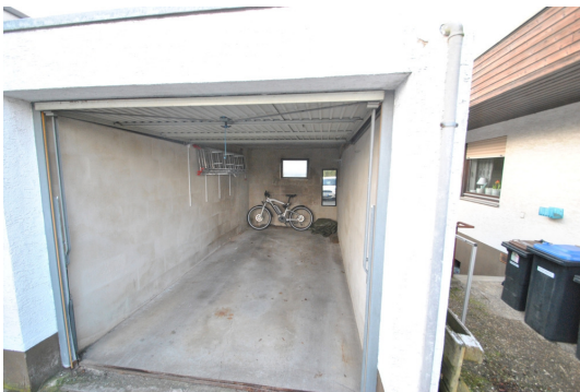
Einzelgarage mit Stellplatz davor