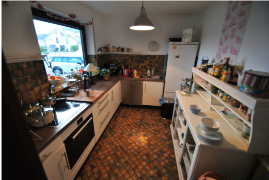
Vermietung ohne EBK