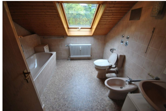
Helles und großzügiges Tageskichtbadezimmer