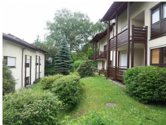
Absolut ruhige Top-Lage