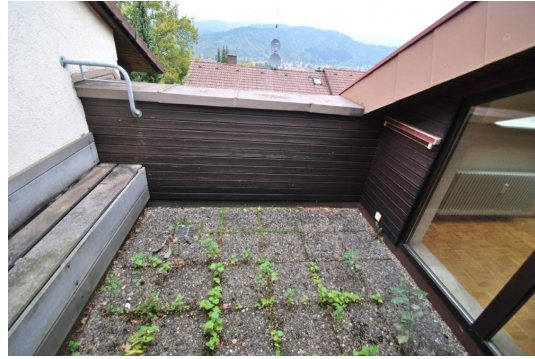
Dachterrasse mit traumhafter Aussicht