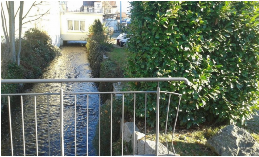
Idyllischer Bachlauf am Grundstück