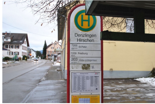
10m vom Hause