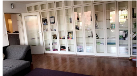
Das Bücherregal ist Bestandteil der Mietsache