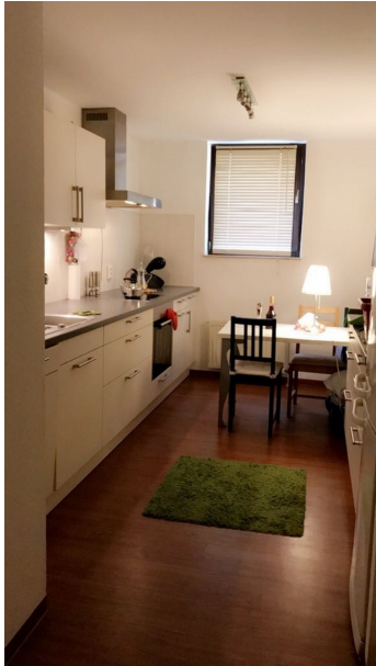
Die EBK ist Bestandteil der Mietsache