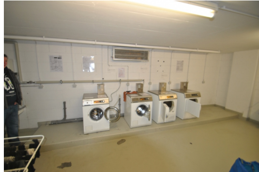
Wash- und Trockenraum