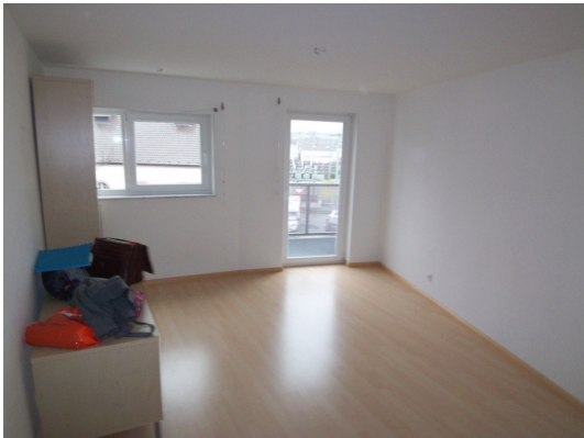
Abb. ähnlich Clever geschnitten