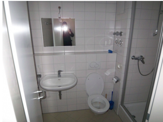
Abb. ähnlich Fußbodenheizung auch im Badezimmer