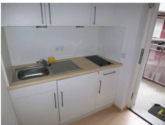
Abb. ähnlich Selber kochen leicht gemacht