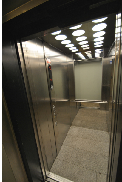
Modern und barrierefrei