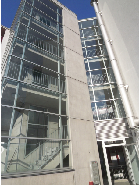
Aufwendige bauliche Gestaltung