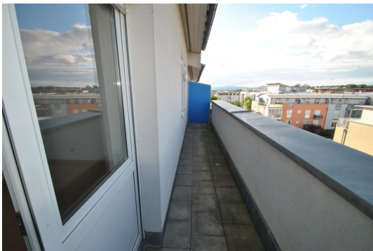
N/O Seite Abb. ähnlich