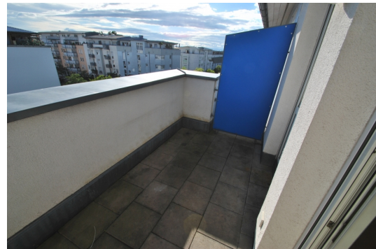
S/W Seite Abb. ähnlich