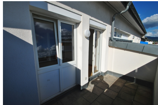
S/W Seite Abb. ähnlich