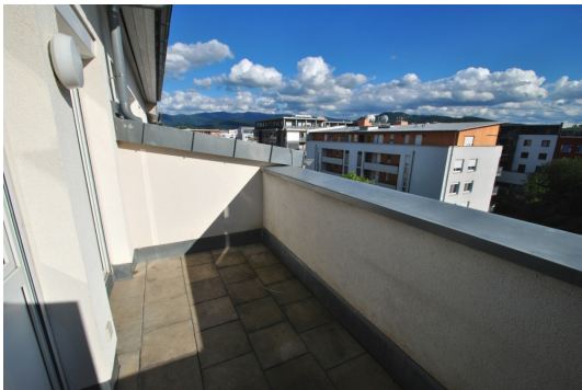
S/W Seite Abb. ähnlich