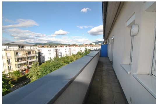
N/O Seite Abb. ähnlich