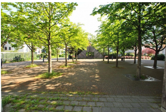
Eingang zum See liegt in nur 150m entfernt