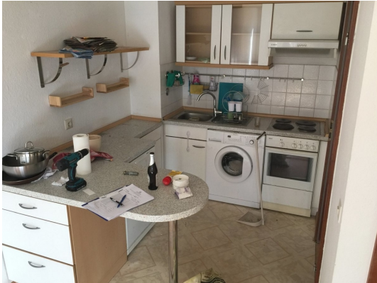
Zum Wohnzimmer offene Küche