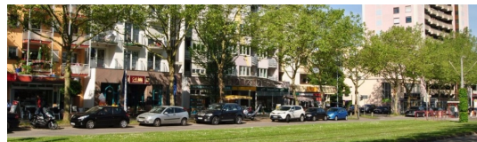
Eis, Cafe, Restaurants und Supermärkte