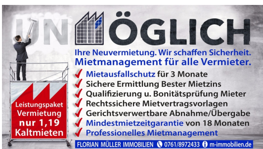
Banner volltext rot telefon quadrat