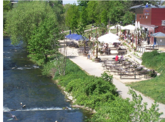
100 m zur Dreisam