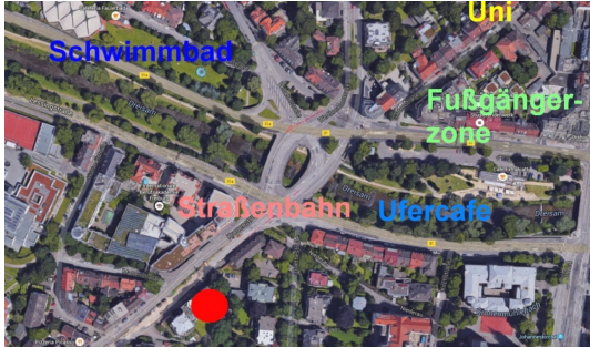
Kronenstr. 5, Perfekte Lage in der Innenstadt