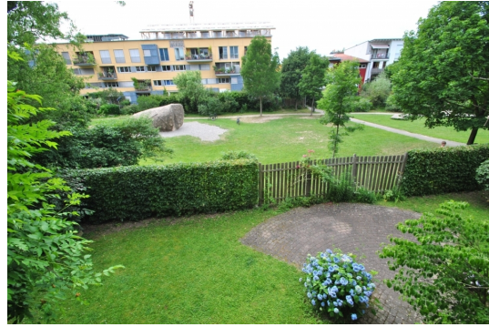
Blick zur Grünsange