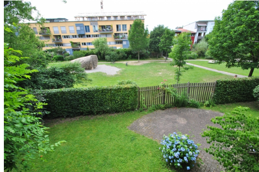
Blick zur Grünsange