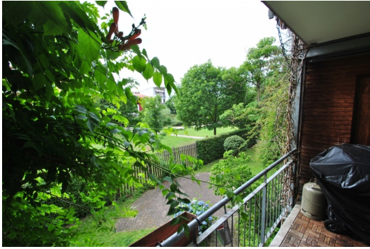
Viel Natur, viel Grün!