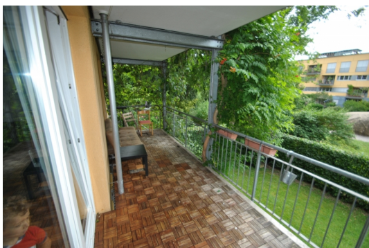
Perfekt für Ihren Feierabend