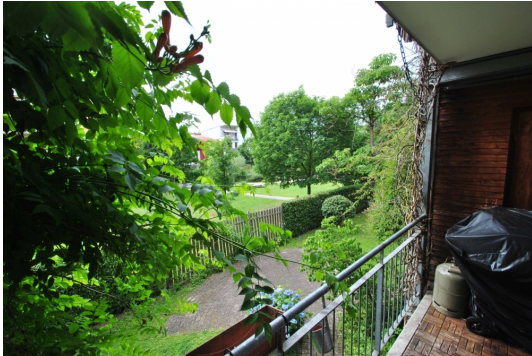
Viel Natur, viel Grün!