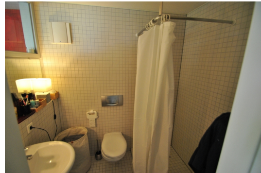
Bad der 1-ZW