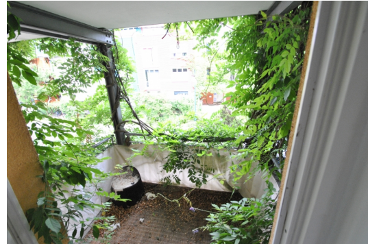
Kleiner Ost-Balkon Schlafzimmer