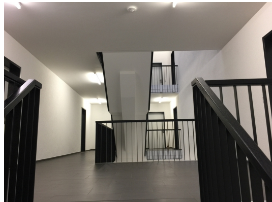
Bauqualität und stilvolle Ausstattungsdetails