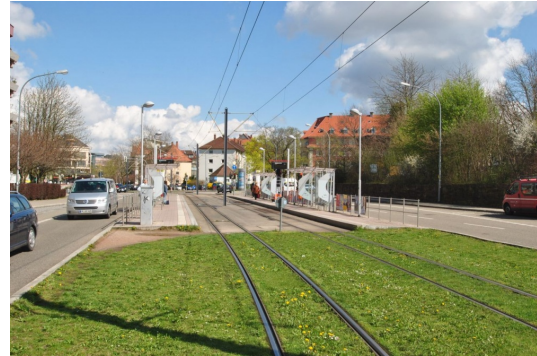
In 5min zur Stadtmittle und Uni