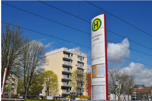
Einige wenige Schritte vom Hause