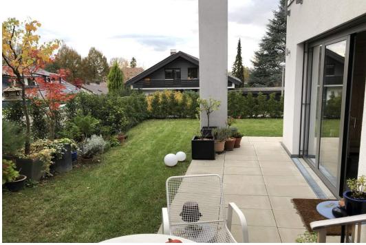
Privatgarten an der Terrasse