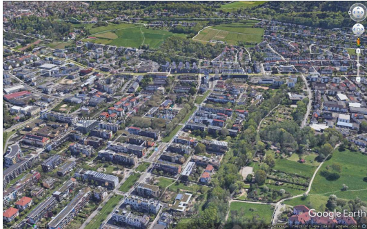
Straßenbahn und Geschäfte