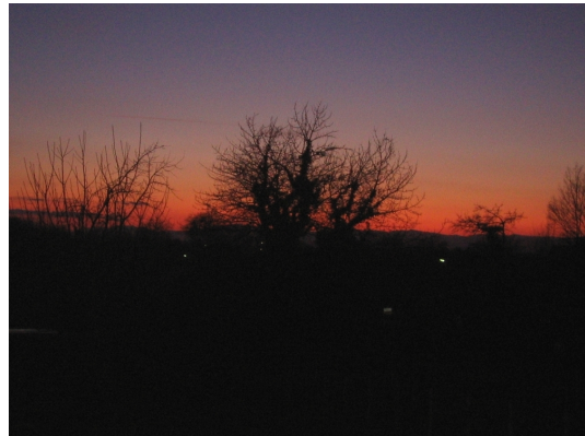
Herrliche Süd West Ausrichtung