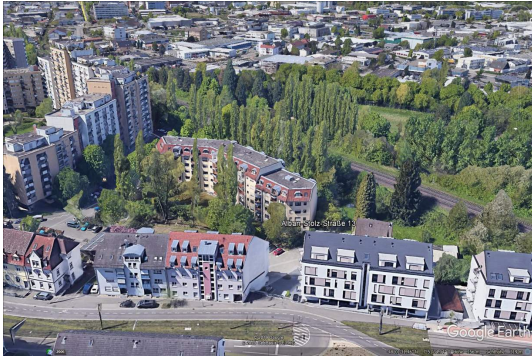
Top Zentrums Lage in Zähringen