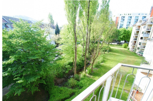
Beispiel Sommer Atmosphäre