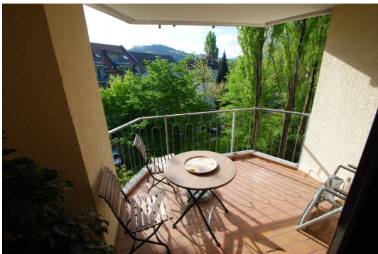
Beispiel sonnige Stunden auf dem Balkon