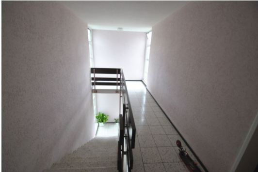
Gepflegtes helles Treppenhaus