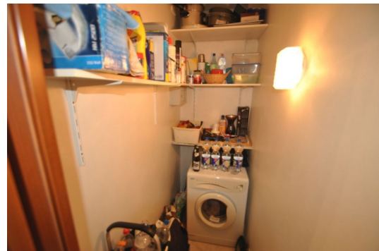
In der Wohnung waschen