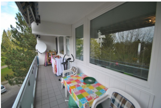
Sonnenbad oder Kaffee und Kuchen auf dem Sonnen- Südbalkon