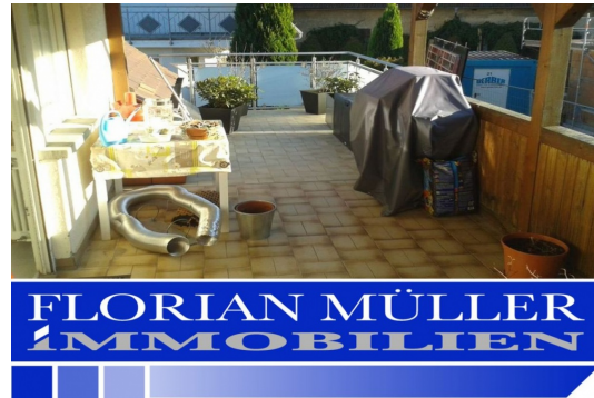
Große teilüberdachte Terrasse