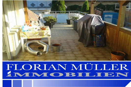
Große teilüberdachte Terrasse