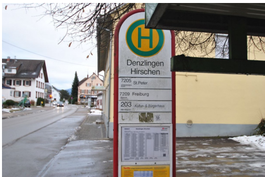
10m vom Hause