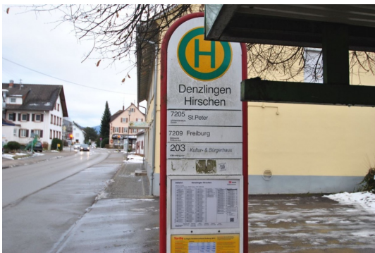
10m vom Hause