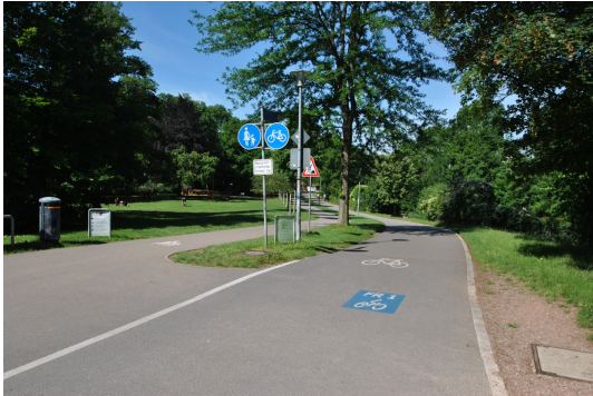
Umgebung mit Radweg FR1