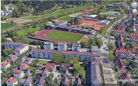
Sport, Spiel und Erholung vor der Türe