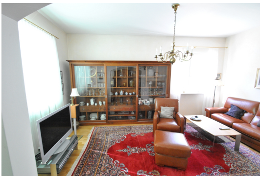
Hohe Decken und viel Licht