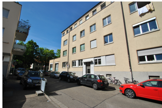
Gesuchte Lage in Freiburg Oberau