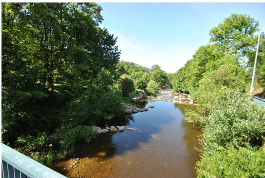
Idyllische Atmosphäre entlang der Dreisam