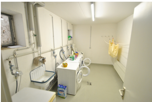
WAMA Anschluss im Keller