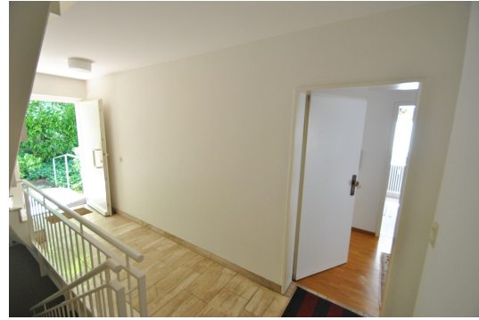
Kurzer Weg von der Haustüre zur Wohnung