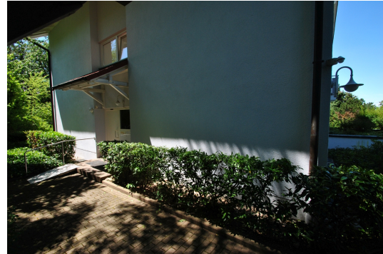
Vor dem Hause