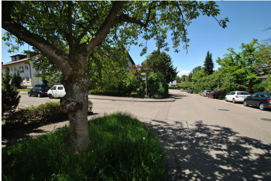
Blick in die Straße