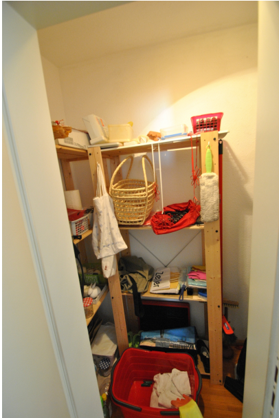
Abstellkammer im Wohnungsflur