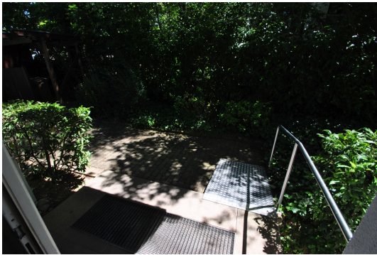
Bequem ins Haus