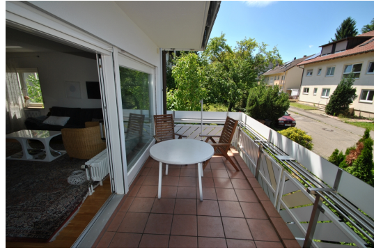
Balkon wie im 1.OG