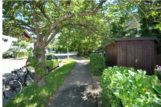
Impression vor dem Hause