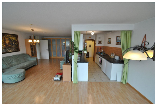
Variabel in der Gestaltung