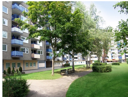
Kita am Hause