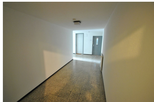
Lift ggü. der Wohnung