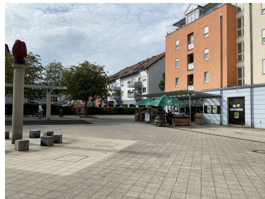
Zähringer Platz um die Ecke