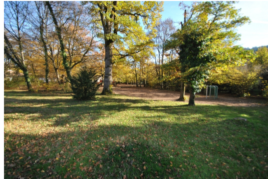
Park ggü. des Hauses