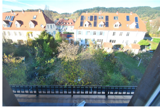
Aussicht vom Dachspitz/Speicher