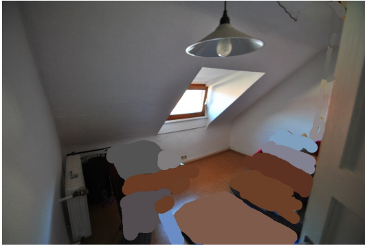
Ein Speicherraum Dachspitz