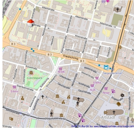
Ruhige Lage Stadtmittle