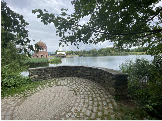
Direkt gegenüber des Hauses